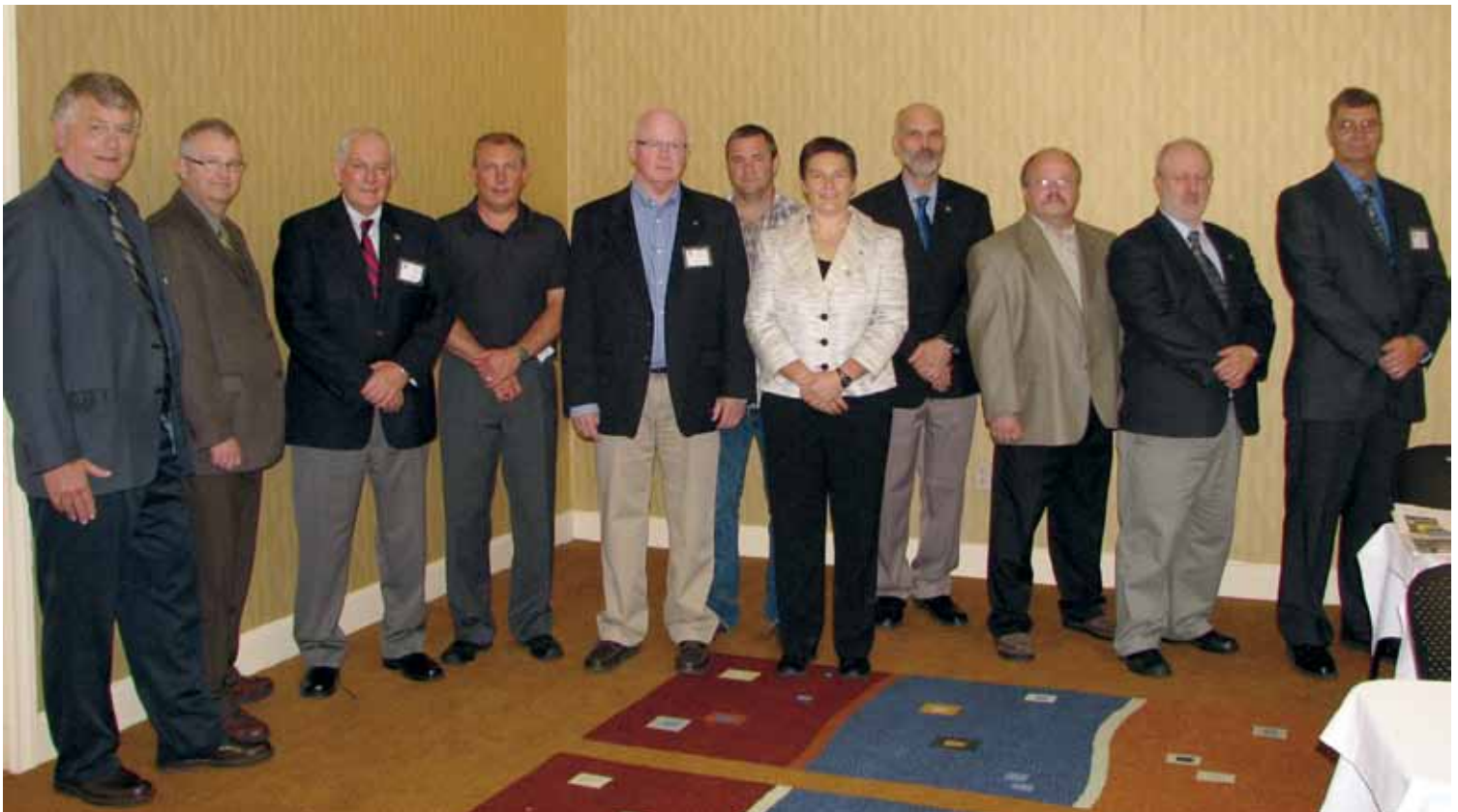
le Conseil national de la Guilde

IL EST PAR CONSÉQUENT RÉSOLU QUE, malgré l'article 8.03 du règlement national, une dispense spéciale soit accordée pour une période de deux ans commençant le 1er décembre 2011 afin de permettre aux anciens membres éligibles de déposer une demande d'adhésion pour rejoindre la Guilde à nouveau au cours de cette période moyennant un frais d'adhésion de vingt dollars.